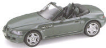
BMW M roadster Hersteller: Minichamps 1:18 - 80 43 9 422 940 € 30,00