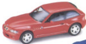
BMW Z3 coupé 2.8 Hersteller: herpa 1:87 - 80 41 9 423 116 € 15,00