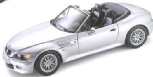
BMW Z3 roadster 1.8 Hersteller: Minichamps 1:18 - 80 43 9 411 712 € 30,00