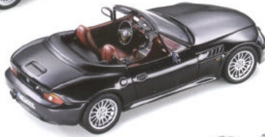
BMW Z3 roadster 1.9 Hersteller: Minichamps 1:18 - 80 43 0 029 556 € 30,00