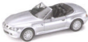
BMW Z3 roadster 1.8 Hersteller: herpa 1:87 - 80 41 9 411 719 € 15,00