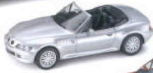
BMW Z3 roadster 1.8 facelift 1:87 80.419.411.718 DM 25,00 EUR 12,78