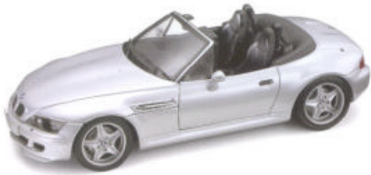
BMW M roadster Hersteller: Minichamps 1:43 - 80 42 9 418 107 € 25,00