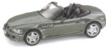
BMW M roadster 1:43 80 42 9 418 107 DM 43,00 EUR 21,99