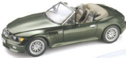
BMW Z3 roadster 2.8 facelift 1:18 80 43 9 411 713 DM 59,00 EUR 30,17