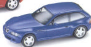
BMW M coupé Hersteller: herpa 1:87 - 80 41 9 423 113 € 15,00