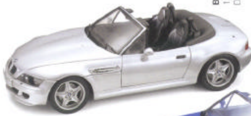
BMW M roadster 1:18 80 43 9 422 940 DM 59,00 EUR 30,17