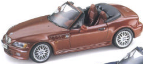
BMW Z3 roadster 2.8 facelift 1:43 80.429.411.715 DM 43,00 EUR 21,99