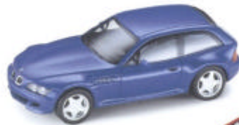
BMW M Coupé Hersteller: herpa 80 41 9 423 113 € 15,-