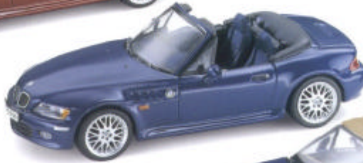
BMW Z3 roadster 1.8 facelift 1:43 80.429.411.714 DM 43,00 EUR 21,99