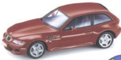
BMW M Coupé Hersteller: Schuco 80 42 9 422 196 € 25,-