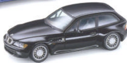
BMW Z3 Coupé 2.8 Hersteller: Schuco 80 42 9 423 172 € 25,-