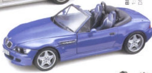
BMW M roadster 1:18 80 43 9 422 999 DM 59,00 EUR 30,17