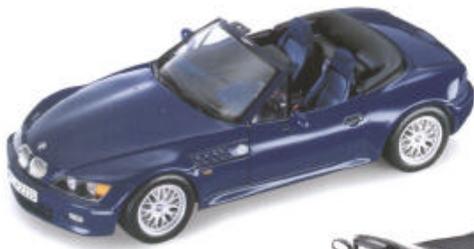
BMW Z3 roadster 3.0 Hersteller: Minichamps 1:18 - 80 43 0 029 557 € 30,00