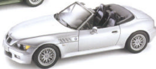
BMW Z3 roadster 1.8 facelift 1:18 80 43 9 411 712 DM 59,00 EUR 30,17