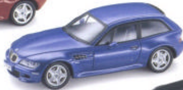
BMW M coupé Hersteller: Schuco 1:43 - 80 42 9 422 195 € 25,00