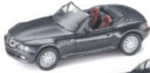
BMW Z3 roadster 1.8 facelift 1:87 80.419.411.716 DM 25,00 EUR 12,78