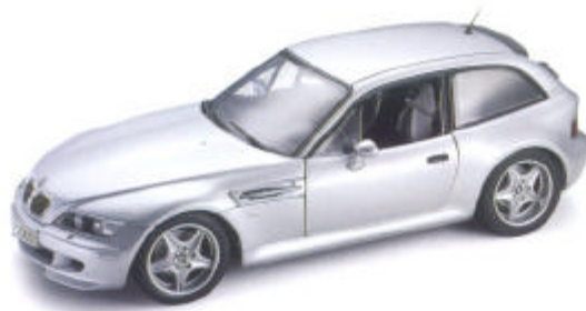
BMW M coupé Hersteller: Minichamps 1:18 - 80 43 0 020 856 € 30,00