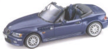
BMW Z3 roadster 1.8 Hersteller: Minichamps 1:43 - 80 42 9 411 714 € 25,00