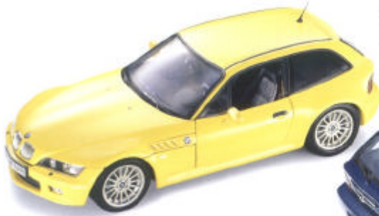
BMW Z3 coupé 3.0 Hersteller: Minichamps 1:18 - 80 43 0 139 876 € 37,00