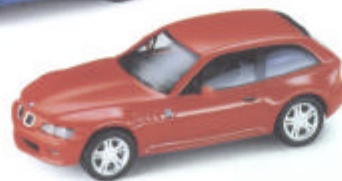
BMW Z3 Coupé 2.8 Hersteller: herpa 80 41 9 423 116 € 15,-