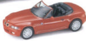
BMW Z3 roadster 1.8 facelift 1:87 80.419.411.716 DM 25,00 EUR 12,78