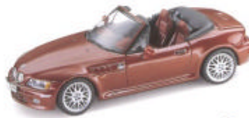
BMW Z3 roadster 2.8 Hersteller: Minichamps 1:43 - 80 42 9 411 715 € 25,00