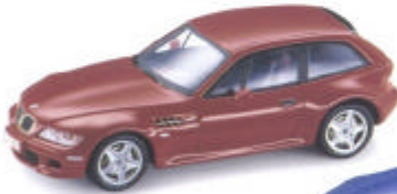
BMW M coupé Hersteller: Schuco 1:43 - 80 42 9 422 196 € 25,00