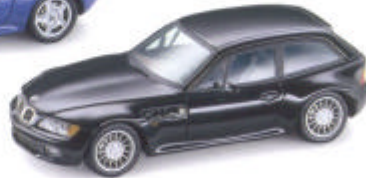
BMW Z3 coupé 2.8 Hersteller: Schuco 1:43 - 80 42 9 423 172 € 25,00