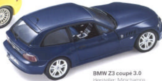
BMW Z3 coupé 3.0 Hersteller: Minichamps 1:18 - 80 43 0 139 870 € 37,00