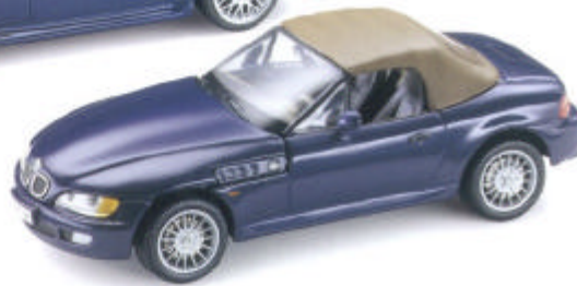
BMW Z3 roadster 1.8/1.9 (Softtop) 1:43 80.429.422.106 DM 20,00 EUR 10,23