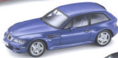
BMW M Coupé Hersteller: Schuco 80 42 9 422 195 € 25,-